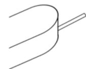
2b - Controller ✗